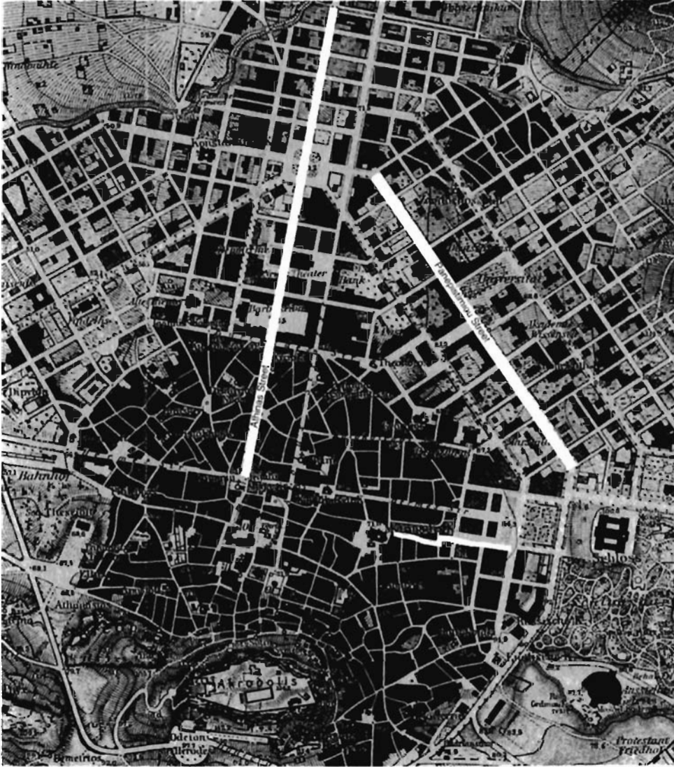
Resim 1. Atina planı, 1877. ayrıntı. Akropol'ün kuzey tarafındaki eski kent, eski düzensiz sokak örüntüsünü korudu. 19. yüzyıl planları birçok sokağa ilk geometrik düzeni getirdi. Bu tartışmanın odak noktası olan üç sokaktan Mitropoleos nitelik olarak eski Atina sokaklarına daha çok benzer, Athinas ve Panepistimiou ise geniş ve düzdür.