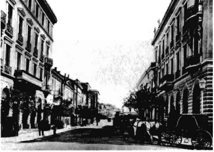
Resim 7. Kentin modernleş- tirilmesinin örneği Athinas Sokağı'nın 1900 civarındaki görünümü.

sı olmak, Yunan yeniden inşa programının açık amacıydı. Başka bir seçenek yoktu. Ulusal bilincin hâlâ Türk karşıtı olmakla eş anlamlı sayıldığı bir zamanda, Osmanlı'dan somut olarak ayrılmaya işaret eden yeni yapılar ile yolların, fiilen ulusal Yunan kimliğini de biçimlendirdiği kabul ediliyordu. 19 Kent sakinleri, birbiri ardından yükselen etkileyici yeni yapılarla, antikçağ yapılarının restorasyonu ve klasik mimarlığın doğduğu ülkeye geri dönmesiyle nasıl gururlandıklarını tekrar tekrar ifade ediyorlardı. 1853'te bir dergide yayınlanan makale, Atina mimarlığının kısa bir süre sonra topluca Türkiye'nin ve İon Adalarının mimarlığını geçeceğini ileri sürerken, "[çünkü] bizim yapılarımız, hiçbir hiza ya da simetri kavramı olmayan alaylı inşaatçılarca değil, Avrupalılar ya da Avrupa'da eğitim görmüş Yunan mimarlarca tasarlandı" 20 diyordu. 19. yüzyılın son otuz yılına kadar ülkede iyi bir mimarlık okulu olmadığından, o zamana kadar bütün önemli yapılar yabancı ülkelerde eğitilmiş mimarlarca tasarlanmış, Bavyeralı müteahhitler ile inşaat ustalarının yönetimi altında yapılmıştı. Çoğu zaman yabancılara çıraklık eden yerel inşaatçılar, zamanla neoklasizmin Atina'da gelişen özel türünü taklit edip önemsiz konutların ihtiyaçlarına da uyarladılar. 21