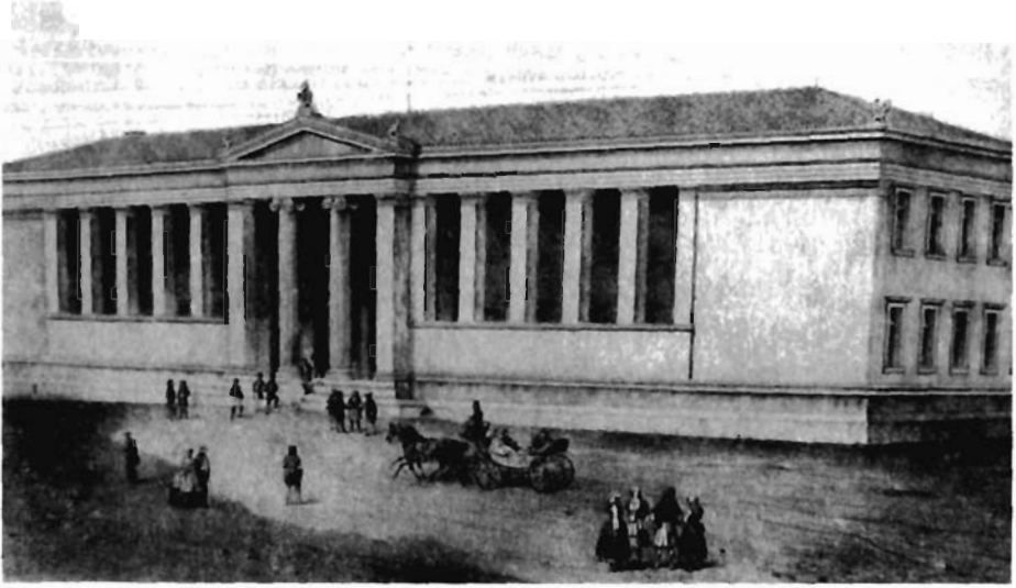
Resim 4. Panepistimiou Sokağı'na bakan üniversite binasını Christian Hansen tasarlamıştı.

na'ya çalışmaya gelen adalılar, eski tepenin çevresinde kendileri ve ailelerine küçük konutlar yapmışlardı. Aslında yasadışı olmasına rağmen varlıklarını korumalarına izin verildi; ancak, Ege'nin değişik yöresel mimarileriyle bu evler, 19. yüzyılın düzenli neoklasik başkenti vizyonuna bugün de olduğu gibi meydan okuyordu. Demek ki, Akropol'ün gölgesindeki modern bir ana cadde olan Athinas Sokağı, bir bütün olarak ele alındığında, klasik kent ile modern kent arasındaki mesafeyi çizmiş, derecelendirmişti.