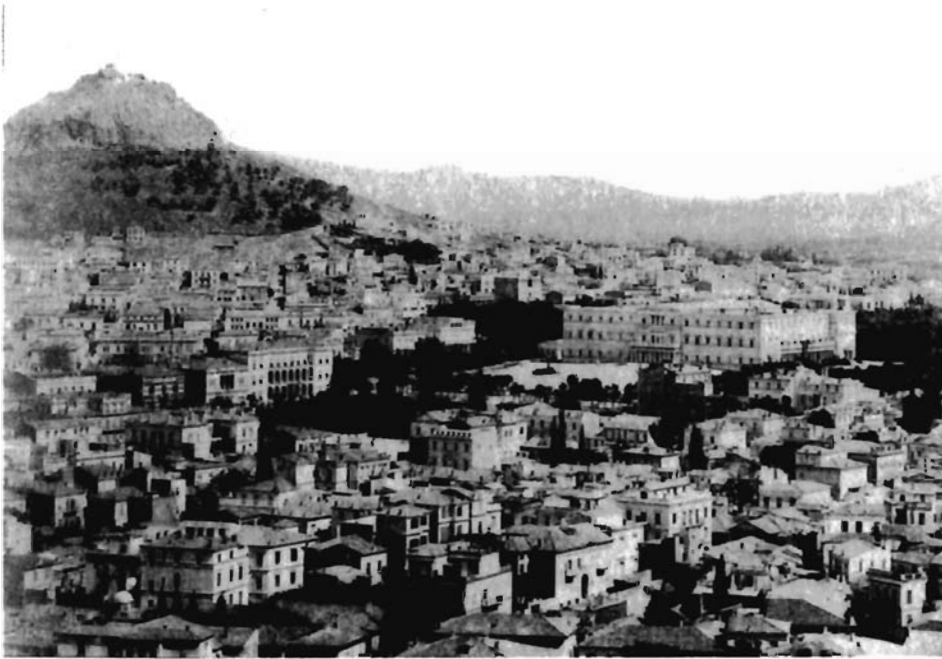
Resim 3. Ortada sağda krallık sarayı ve önünde Syntagma Meydanı'yla kentin genel görünümü. Lycabettos Tepesi soldadır.

nara bırakılırsa, kent üzerindeki etkileri kuşku götürmezdi. Örneğin, kent kurulunda yeni akademi binasının uygun olup olmadığı tartışmasında şu sözler sarfedilmişti: “Üniversite Meydanı’nda yapılacak olan akademinin, belediye ve ulusa büyük etik ve maddi yararı olacağı gibi, kentin güzelleşmesine de katkısı olacaktır. Ulusun etik ve somut gelişmesine katkıda bulunan herhangi bir çalışmayı desteklemenin belediyenin yararına olduğu inancıyla, [kent kurulu] bu arsayı bağışlamaya oybirliğiyle karar vermiştir.” 12 (Res. 5) Benzer savlar, Atina Üçlüsü’nü bütünleyen ulusal kitaplığın yapılmasını da destekliyordu. Sarayın önündeki zarif, ağaçlıklı Syntagma (Anayasa) Meydanı’nda biten Panepistimiou Sokağı, hem simgesel olarak, hem de kelime anlamıyla, resmi kültürel üretimi kralın ikametgâhına bağlayan hattı çizmişti (Res. 6). 13