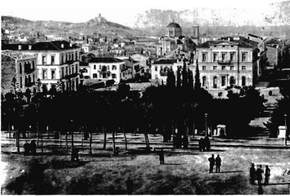
Resim 6. Syntagma Meydanı'nın güneybatı köşesi, 1865. Mitropoleos Sokağı'ndaki yeni evlerle yan yana olan yeni katedral arka planda görülüyor.

ısrarcı, evcilleştirilmemiş, kaba ve popüler taşra kültürü arasındaki bağlantıyı açıkça görmek gerekir. Değişime gösterilen muhalefet özellikle ilginçtir; bu muhalefet fiziksel olarak kentin dokusunda ve sözel olarak dönemin basınında ifade ediliyordu. Bir düzeyde, kararsız kent toplumu Atina'daki dönüşümü destekleyip yeni yapıların güzelliğine aşık olurken, başka bir düzeyde bu dönüşümden nefret edip direnmişti ve hâlâ da direniyor.