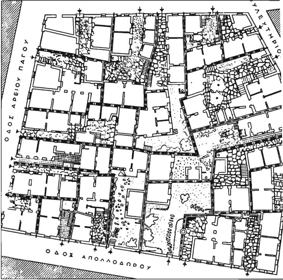
Resim 8. Areios Pagos'un kuzeyinde yer alan ve Roma Forumu kazılan sırasında yıkılan bütün bir blok-taki evlerin planı. Cepelerde sokakla görece düzgün bir hizalama yapıldıysa da, blokun içi Osmanlı yıllarının karmaşık mülkiyet örüntüsünü korumuştur.

politikalarına, inşa programlarına yöneltilen eleştiriler de eksik olmuyor, hatta keskin bir muhalefete de dönüşebiliyordu. Bu kısmen eleştirilenlerin hangi safta olduğuyla ilgiliydi. Son yüzyılda Atina'da satılan birçok gazetenin başmakalelerini ve yazılarını renklendiren keskin politik bir gün-